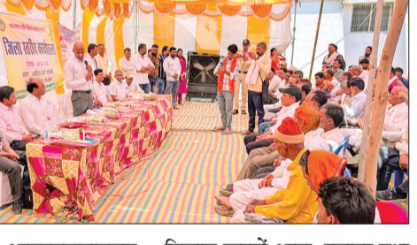
हरिभूमि न्यूज नैट्स

इस अवसर पर उन्होंने परंपरागत कृषि विकास योजना (PKVY) की विस्तृत जानकारी देते हुए अधिकारियों को निर्देश दिए कि योजना का अधिक से अधिक प्रचार-प्रसार किया जाए, ताकि किसान प्राकृतिक खेतों की ओर आकर्षित हों। उन्होंने उर्वरकों के