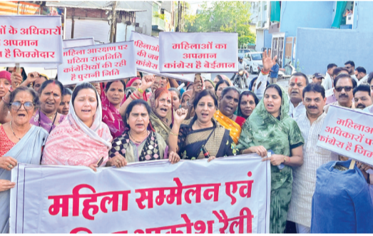
हरिभूमि न्यूज नैट्स

शहर में नारी शक्ति वंदन बिल के समर्थन में बीजेपी महिला मोर्चा ने शहर में प्रदर्शन करते हुए कांग्रेस के खिलाफ जोरदार विरोध दर्ज कराया। इस दौरान कार्यकर्ताओं ने कांग्रेस सहित अन्य विपक्षी दलों के नेताओं का पुतला दहन किया और जमकर नारेबाजी की। इस मौके पर शुक्रवार को भाजपा कार्यालय में भाजपा की ओर से प्रेस वार्ता का आयोजन किया गया था। जिसमें प्रमुख रूप से भाजपा जिलाध्यक्ष