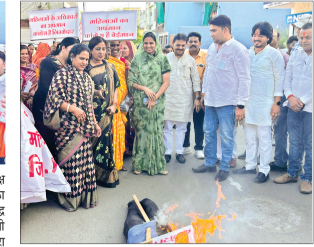
हरिभूमि न्यूज नैट्स

शहर में नारी शक्ति वंदन बिल के समर्थन में बीजेपी महिला मोर्चा ने शहर में प्रदर्शन करते हुए कांग्रेस के खिलाफ जोरदार विरोध दर्ज कराया। इस दौरान कार्यकर्ताओं ने कांग्रेस सहित अन्य विपक्षी दलों के नेताओं का पुतला दहन किया और जमकर नारेबाजी की। इस मौके पर शुक्रवार को भाजपा कार्यालय में भाजपा की ओर से प्रेस वार्ता का आयोजन किया गया था। जिसमें प्रमुख रूप से भाजपा जिलाध्यक्ष